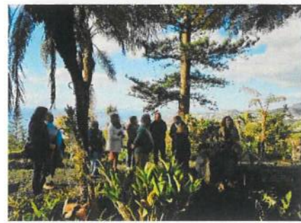
Visita ao Jardim Botânico

A segunda visita foi ao Jardim do Núcleo dos Dragoeiros das Neves, em São Gonçalo, no dia 6 de fevereiro, com 7 pessoas inscritas.