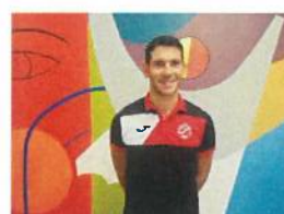
Corpo técnico da Escolinha de Futebol