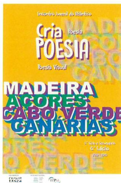
Cartaz do CriaPOESIA 19/20