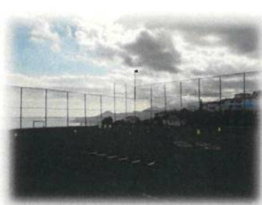
Escolinha de Futebol