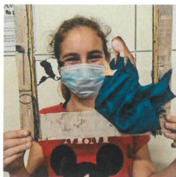
Concurso "Presépio Ecológico"