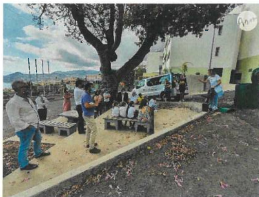
Ação de Sensibilização sobre a compostagem doméstica - ARM

Por último, foi entregue à CRIAMAR e ao Conjunto Habitacional de São Gonçalo dois combustores pela ARM – Águas Residuais da Madeira, no âmbito do projeto “O Meu Composto”, de modo ajudar na produção de terra fértil para as zonas verdes do Bairro. Nessa entrega, foi feita ainda uma ação de sensibilização sobre compostagem doméstica aos moradores do Bairro.