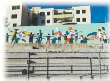
Mural de São Gonçalo