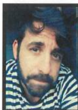
Miguel Sobral Artes plásticas Design