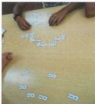
Apoio ao Estudo no Lar da Paz

Tal como na área de desporto, e ainda no terceiro trimestre 2020, foi iniciada a oficina do conhecimento: + APRENDER para a iniciação do apoio ao Estudo a 5 jovens da fundação Lar da Paz, nomeadamente na escolaridade do 5º, 6º e 8º ano. Desta forma, o Apoio ao Estudo abrange, no total, de 16 crianças/jovens, onde a CRIAMAR tenta ajudá-las quer no seu sucesso escolar, como também no seu desenvolvimento pessoal.