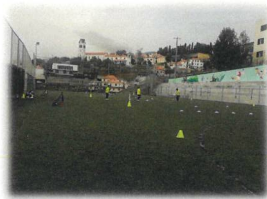
Campo Prof. Luís Ferreira, São Gonçalo

Pintura Mural São Gonçalo: Iniciativa da área das Artes Plásticas, da CRIAMAR em parceria com a junta de Freguesia de São Gonçalo, onde as crianças da Escolinha de Futebol deram o seu contributo.