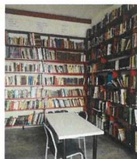
BCMP - Biblioteca Comendador Manuel Pestana

Ainda, foi iniciada o protocolo de adesão ao Catálogo Cooperativo do Arquivo Regional e Biblioteca Pública da Madeira (ABM), através da entrada do pedido e depois a exportação de registos bibliográficos, para posterior integração na base de dados da ABM.