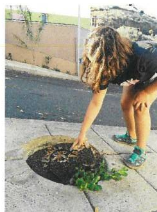
Crianças no Jardim Florescer CRIAMAR