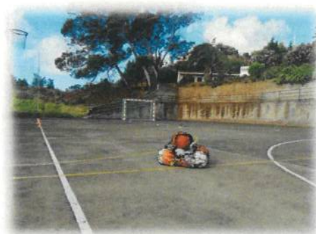
Lar da Paz

Estádio da Madeira: visita de estudo ao estádio de futebol, com objetivo de proporcionar momentos de conhecimento diferentes e que possa ficar na memória destes Jovens. Clube Desportivo Nacional ofereceu uma t-shirt Oficial autografada pelos jogadores da equipa sénior à Instituição do Lar da Paz.