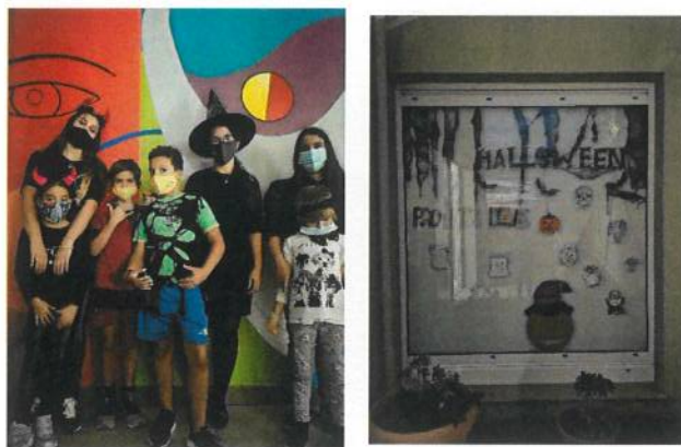
Pão Por Deus e Halloween