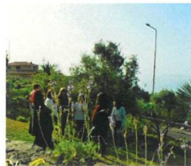
Visita ao Jardim do Núcleo dos Dragoeiros