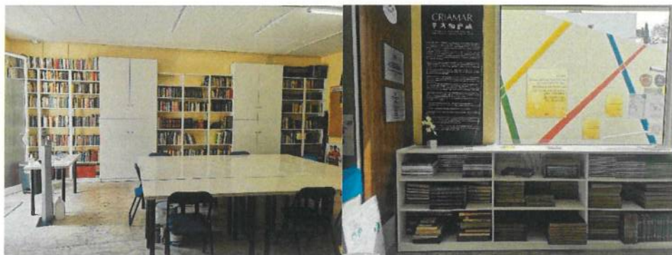
Polo Atividades de São Gonçalo

O polo de atividades assume polivalência de diversas atividades que a CRIAMAR desenvolve. Devido ao plano de contingência para a contenção do vírus COVID-19 decretado pelo Governo Regional da Madeira, o polo de atividades de São Gonçalo, teve encerrado ao público do dia 16 de março até 12 de julho. O espaço foi reaberto a 13 de julho, com a criação do plano de contingência e o cumprimento das normas de segurança e de higiene.