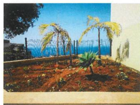
Antes e Depois - Jardim Florescer CRIAMAR