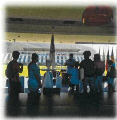
Visita ao Estádio da Madeira