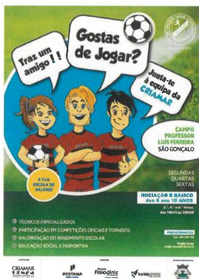
Cartaz Escolinha de Futebol da CRIAMAR

Treinos programados: segundas-feiras, quartas-feiras, sextas-feiras – das 18H15 às 20H00 Campo Prof. Luís Ferreira e sábado (9H15 às 11H) Escola dos Louros.