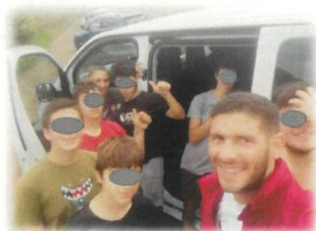
Visita ao Cais do Sardinha