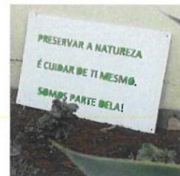
Sinaléticas - Educação Ambiental